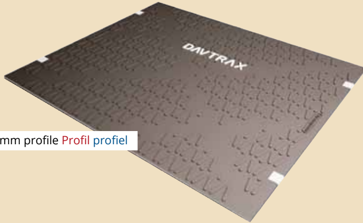
7 mm profile Profil profiel

1 paneel 2 verschillende profielen 3 afmetingen